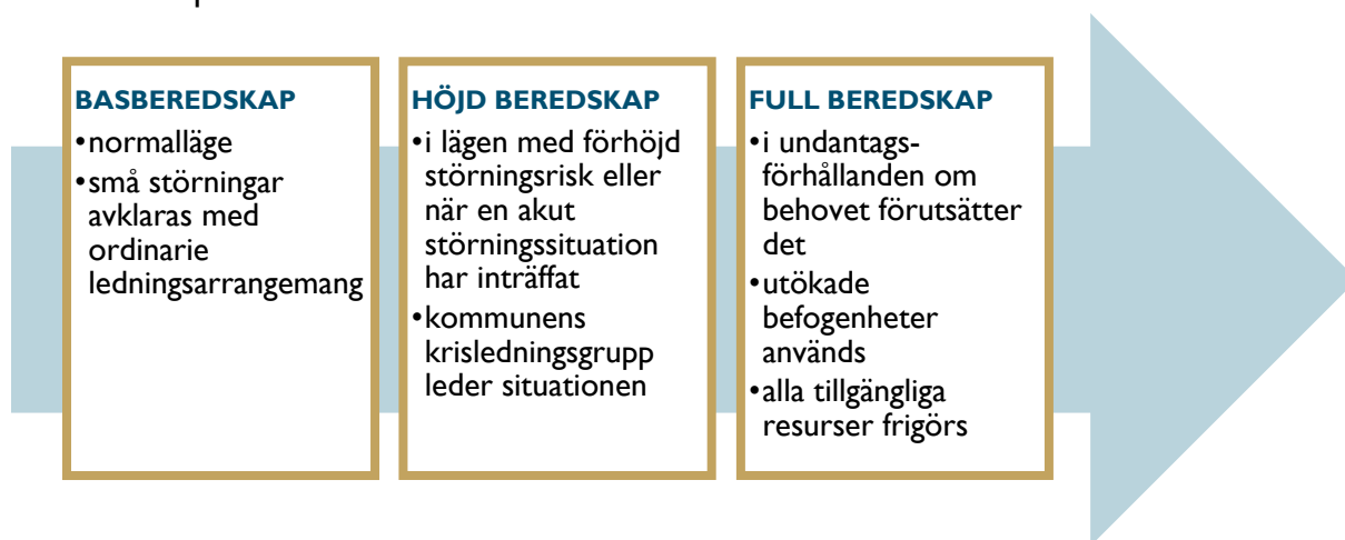
Bild: Pedersöre kommuns process för skärpning av beredskapen.

Beredskapen kan indelas i tre olika nivåer: kommunens basberedskap, höjd beredskap samt full beredskap.