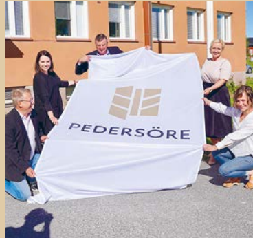
↑ Så här såg det ut när Pedersöre lanserade sin logo i juni.

Meillä on nyt käytössä ilmoitusmalleja, joihin voimme lisätä kuvia, sekä yksinkertaisempia malleja, jotka sisältävät vain tekstiä. Kirjepohjat, kirjekuoret, Powerpoint-pohjat, liput ja autojen teippaukset