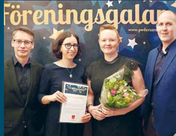
↑ Årets arrangör: Byrådet i Överesse.

En förening eller frivillig som under året ordnat ett evenemang som har engagerat många personer eller som på ett tilltalande sätt lyft fram Pedersöre som en aktiv kommun. Årets arrangör har med sin verksamhet också breddat serviceutbudet i kommunen på ett synligt sätt. Årets arrangör kan även ha drivit ett