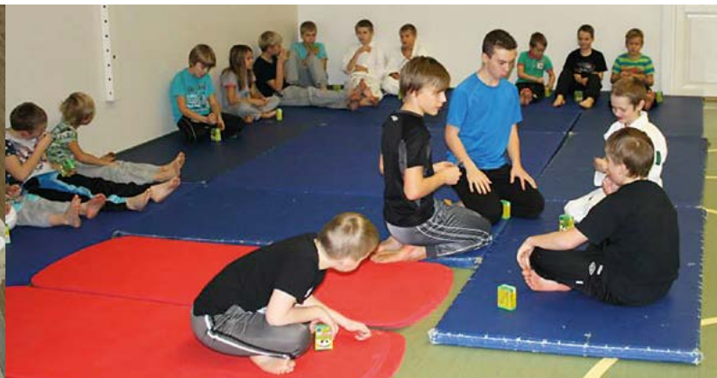
Budoskolans hösttermin avslutades 2.12.2014 med en julfest.