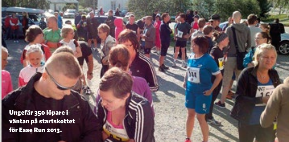
Ungefär 350 löpare i väntan på startskottet för Esse Run 2013.