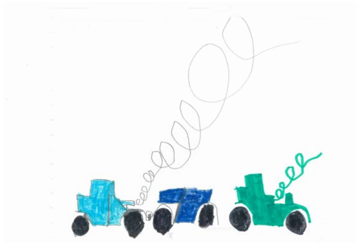
"Vi kommer till dagis med bilar" Pontus 6 år

Pedersöre kommun kan i enlighet med kommunfullmäktiges beslut bevilja skolskjuts till Pedersöre gymnasium för studerande bosatta i Pedersöre vilka har en skolväg som överstiger 5 km under förutsättning att skjutsningen kan ordnas ändamålsenligt och ekonomiskt varvid kommunens trafikförhållanden, skjutsningen av skoleleverna i den grundläggande undervisningen och befintliga skjutsrutter beaktas. Den studerande eller studerandes vårdnadshavare svarar för en fastställd självriskandel.