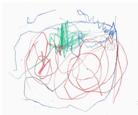
Elli 2 år 6 mån