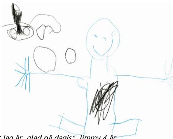
"Jag är glad på dagis" Jimmy 4 år